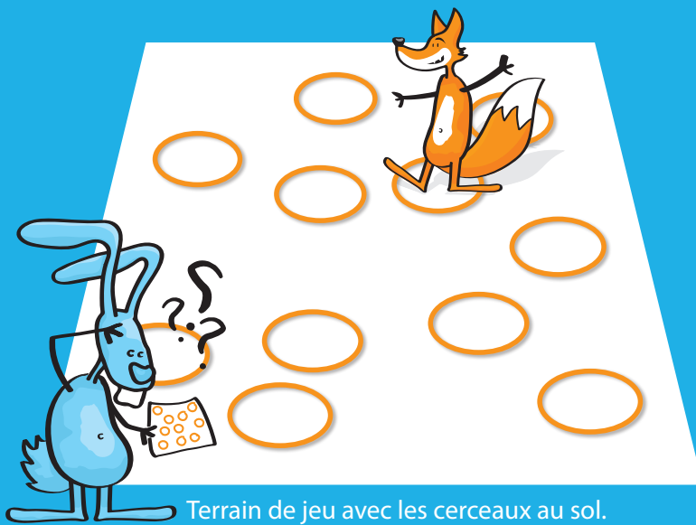
Terrain de jeu avec les cerceaux au sol. Dans quel cerceau s'est placé Fino ?